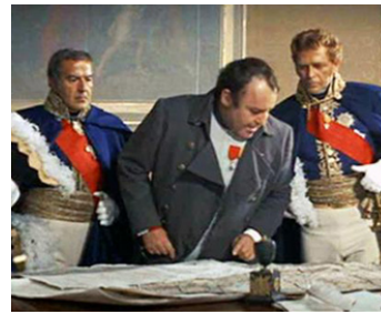
1970 WATERLOO (Waterloo) de Sergueï Bondartchouk avec Evgueni Samoilov