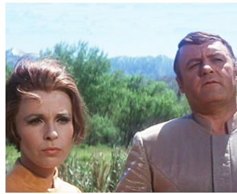
1969 L'HOMME TATOUÉ (The illustrated Man) de Jack Smight avec Claire Bloom