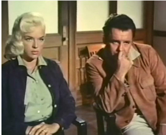
1957 LA FEMME ET LE RÔDEUR (The unholy Wife) de John Farrow avec Diana Dors