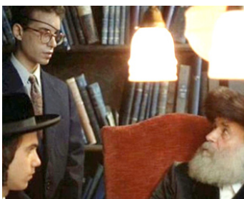
1982 L'ÉLU (The Chosen) de Jeremy Paul Kagan avec Robby Benson, Barry Miller