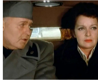
1973 LES DERNIERS JOURS DE MUSSOLINI (Mussolini, ultimo atto) de Carlo Lizzani avec Lisa Gastoni