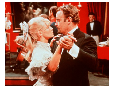
1966 DOCTEUR JIVAGO (Doctor Zhivago) de David Lean avec Julie Christie