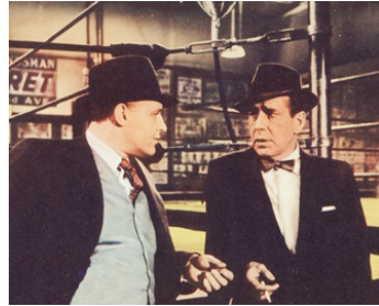
1956 PLUS DUR SERA LA CHUTE (The harder they fall) de Mark Robson avec Humphrey Bogart