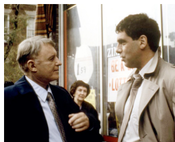
1983 MACHINATION (The naked Face) de Bryan Forbes avec Elliott Gould