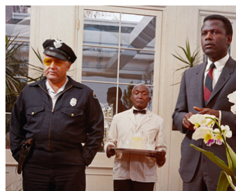
1967 DANS LA CHALEUR DE LA NUIT (In the Heat of the Night) de N. Jewison avec Sidney Poitier