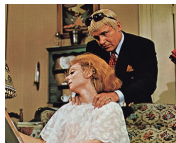
1968 LE REFROIDISSEUR DE FEMMES (No way to treat a Lady) de J. Smight avec Lee Remick