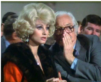
1978 AVEC LES COMPLIMENTS DE CHARLIE (Love & Bullets) de S. Rosenberg avec J. Ireland