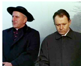
1965 UN HOMME EST VENU (E venne un Uomo) d'Ermano Olmi avec Adolfo Celli