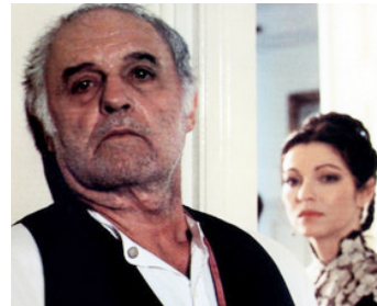
1981 LA MONTAGNE MAGIQUE (Der Zauberberg) de H. Geissendörfer avec Marie-France Pisier