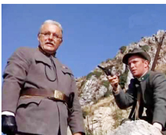
1966 LA FILLE ET LE GÉNÉRAL (La Ragazza e il Generale) de P. Festa Campanile avec U. Orsini