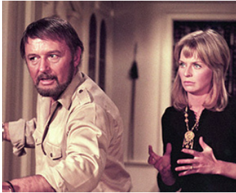
1971 HAPPY BIRTHDAY, WANDA JUNE de Mark Robson avec Susannah York