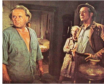
1972 UNE FILLE NOMMÉE LOLLY MADONNA (Lolly Madonna XXX) de R. Sarafian avec R. Ryan