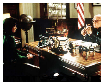
1998 LA TÊTE DANS LE CARTON À CHAPEAUX (Crazy in Alabama) d'A. Banderas avec M. Griffith