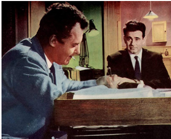
1960 L'EMPREINTE (The Mark) de Guy Green avec Stuart Whitman