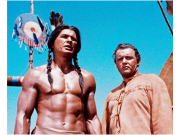
1957 LE JUGEMENT DES FLÈCHES (Run of the Arrow) de Samuel Fuller avec Ch. Bronson