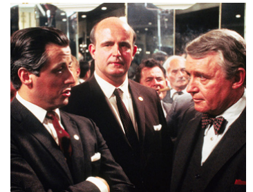
1978 F.I.S.T. (F.I.S.T.) de Norman Jewison avec Sylvester Stallone, Peter Boyle