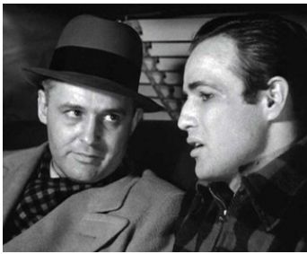
1954 SUR LES QUAIS (On the Waterfront) d'Elia Kazan avec Marlon Brando