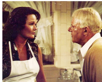
1976 W. C. FIELDS ET MOI (W. C. Fields and me) d'Arthur Hiller avec Valerie Perrine