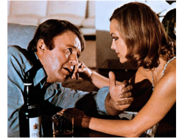
1974 LES INNOCENTS AUX MAINS SÂLES de Claude Chabrol avec Romy Schneider