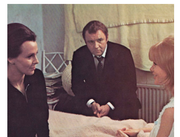
1968 AUTO-STOP GIRL (Three into two won't go) de Peter Hall avec C. Bloom, Judy Greeson