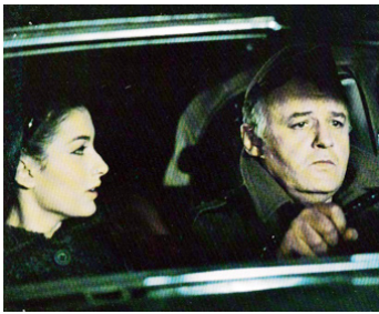
1968 LE SERGENT (The Sergeant) de John Flynn avec Ludmila Mikael