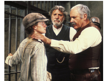
1981 CATTLE ANNIE AND LITTLE BRITCHES de L. Johnson avec A. Plummer, B. Lancaster