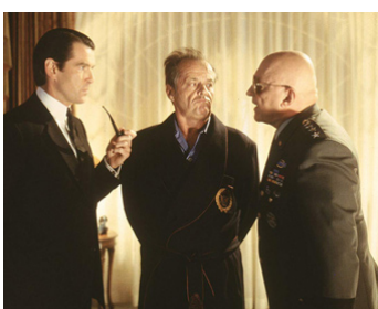
1996 MARS ATTACKS (Mars Attacks I) de Tim Burton avec Pierce Brosnan, Jack Nicholson