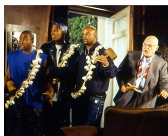
1997 REVENANT (Modern Vampires) de R. Effman avec Flex Alexander, C. Terrell, V. Togunde