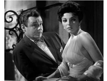
1959 LES SEPT VOLEURS (Seven Thieves) de Gordon Douglas avec Joan Collins