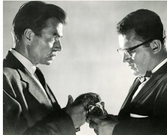
1958 CRI DE TERREUR (Cry Terror) d'Andrew L. Stone avec James Mason