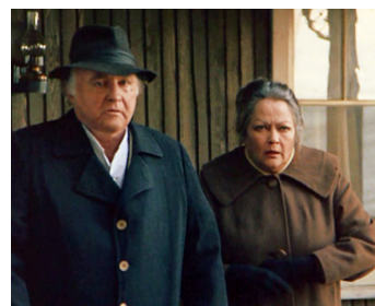
1985 UNE AFFAIRE DE FAMILLE (American Gothic) de John Hough avec Yvonne De Carlo