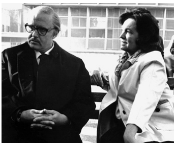
1964 LE PRÊTEUR SUR GAGES (The Pawnbroker) de Sidney Lumet avec Geraldine Fitzgerald