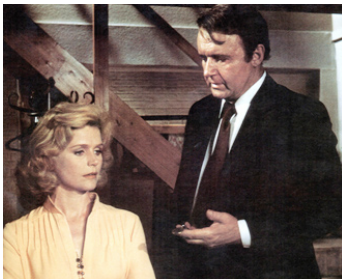
1975 LE GRAND DÉFI (Hennessy) de Don Sharp avec Lee Remick