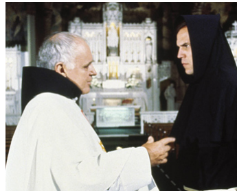
1979 AMITYVILLE, LA MAISON DU DIABLE (The Amityville Horror) de S. Rosenberg avec Don Stroud