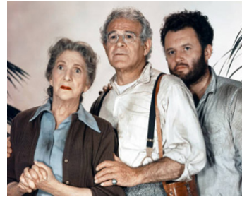
1956 LES ÉCHAPPÉS DU NÉANT (Back from Eternity) de J. Farrow avec Beulah Bondi, C. Prud'homme