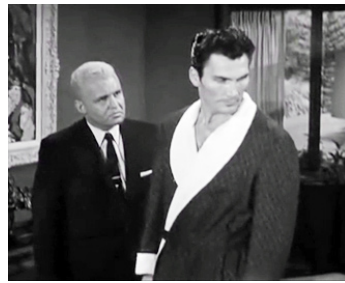
1954 LE GRAND COUTEAU (The big Knife) de Robert Aldrich avec Jack Palance