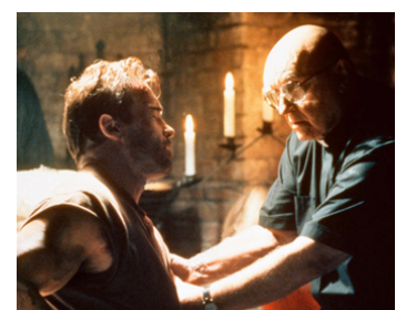
1999 LA FIN DES TEMPS (End of Days) de Peter Hyams avec Arnold Schwarzenegger