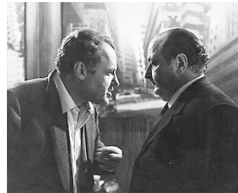
1963 MAIN BASSE SUR LA VILLE (Le Mani sulla Città) de Francesco Rosi avec Salvo Randone