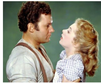
1955 OKLAHOMA (Oklahoma !) de Fred Zinnemann avec Shirley Jones