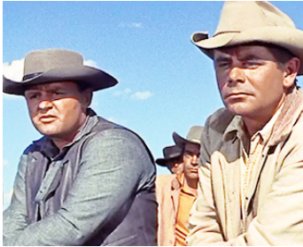
1956 L'HOMME DE NULLE PART (Jubal) de Delmer Daves avec Glenn Ford