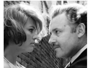
1964 LES DEUX RIVALES (Gli Indifferenti) de Francesco Maselli avec Claudia Cardinale