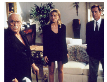
1993 L'EXPERT (The Specialist) de Luis Llosa avec Sharon Stone, James Woods