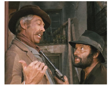
1971 IL ÉTAIT UNE FOIS LA RÉVOLUTION (Giu la testa) de S. Leone avec James Coburn